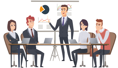
Bildquelle: „Meeting office“ von ONYXprj, modifiziert von der CGVI GmbH

Dieses Seminar bietet den optimalen Einstieg für Mitarbeiterinnen und Mitarbeiter, die mit betriebswirtschaftlichen Zusammenhängen sowie Fachbegriffen des Controllings wenig vertraut sind. Im Rahmen eines haptischen Planspiels erlernen Sie die wichtigsten Stellschrauben und Zusammenhänge des Controllings kennen. Nach diesem Seminar agieren Sie souverän mit elementaren Grundbegriffe und Methoden aus den Bereichen Controlling, Kostenrechnung, Budgetierung und Finanzbuchhaltung.